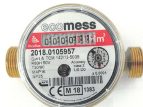
Рис. 2 Лічильник води Picoflux